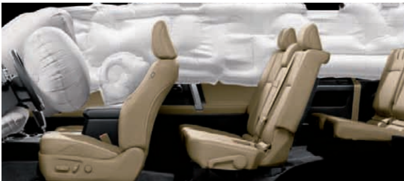
Intérieur du 4Runner SR5 V6 avec groupe Limited montré en cuir beige sable.

Un véhicule qui s'aventure sur un terrain difficile doit être plus que robuste. Le nouveau 4Runner possède de série huit coussins gonflables, notamment des coussins latéraux montés dans les sièges avant et des coussins latéraux en rideau à l'avant et à l'arrière à détecteurs de roulis et interrupteur de désactivation.