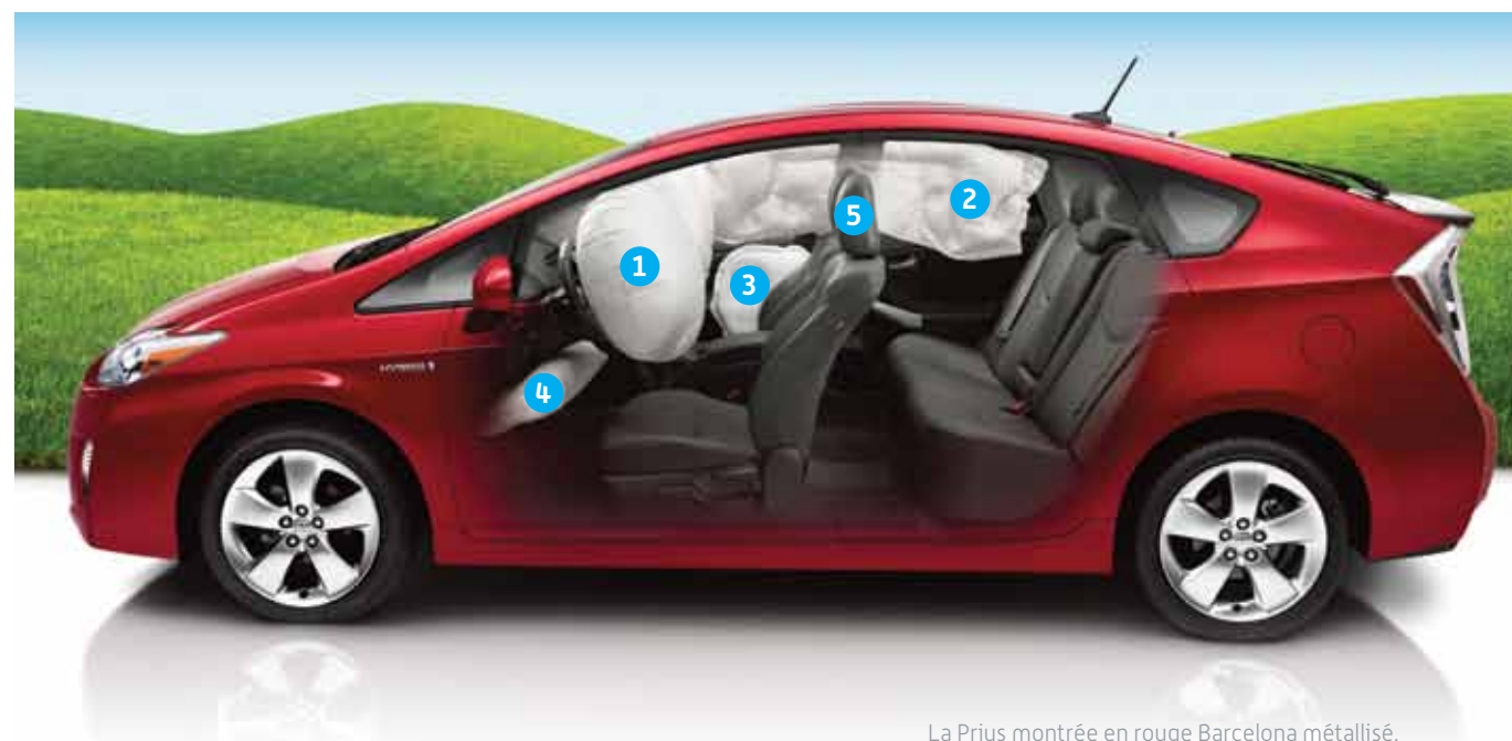
La Prius montrée en rouge Barcelona métallisé.

Toyota se soucie autant de votre bien-être que de celui de la planète. Voilà pourquoi la Prius 2011 est équipée d'un ensemble de caractéristiques de sécurité conçues pour aider à protéger ses occupants de pratiquement tous les angles. La Prius est proposée en option avec un régulateur de vitesse dynamique à radar pouvant détecter les véhicules qui vous devancent et qui ajuste automatiquement votre vitesse pour maintenir une bonne distance entre les véhicules. S'il arrive qu'une collision frontale est inévitable, le système pré-collision en option agit automatiquement sur les freins et resserre les ceintures de sécurité avant pour aider à réduire les conséquences de la collision.