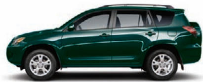
6T3 Forêt noire nacré B,C,E,F