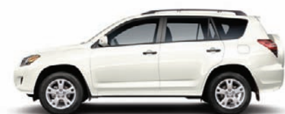
040 Blanc alpin A,C,F