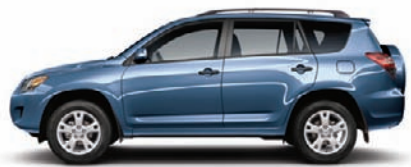
8R3 Bleu Pacifique métallisé A,C,D,F