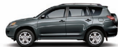
1G3 Gris magnétique métallisé C,F (Sport seulement)