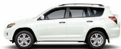
070 Blizzard nacré D (Limited seulement)