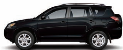
202 Noir A,C,D,F