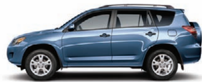
8R3 Bleu Pacifique métallisé A,C,D,F