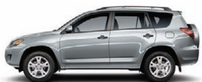
1F7 Argent classique métallisé A,C,D,F