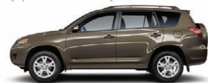
4T3 Pyrite mica B,E (De base, Limited seulement)