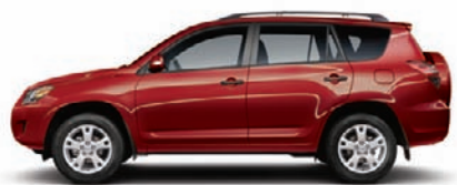
3R3 Rouge Barcelona métallisé A,C,D,F