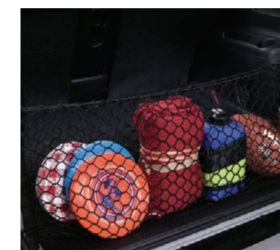
Filet de rétention

Système Bongiovi Acoustics DPS Système de processeur/amplificateur audio numérique pour une performance audio optimale.