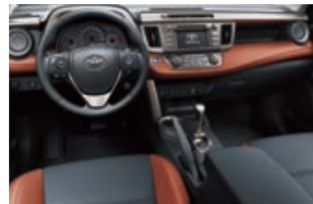
SofTex MD terre cuite/noir

Pour plus de détails, veuillez consulter votre concessionnaire Toyota.