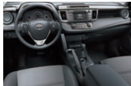
Tissu gris cendré