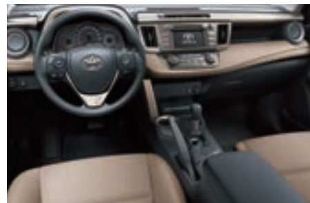
Tissu beige sable