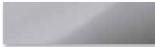
1D6 Ciel argent métallisé