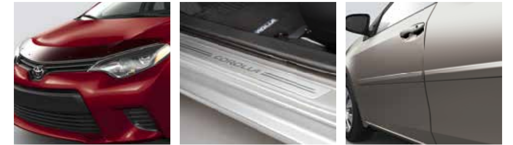
Déflecteur de capot

ACCESSOIRES TRD Système d'échappement TRD Barre stabilisatrice arrière TRD