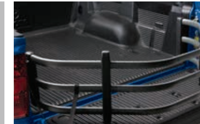
Rallonge de caisse