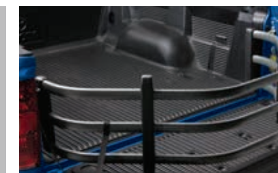
Rallonge de caisse