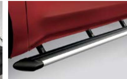
Barres-marchepieds latérales ovales de 4 po