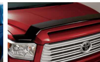
Déflecteur de capot