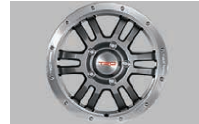
Roues de 17 po hors route forgées TRD