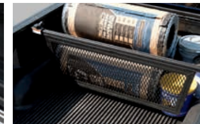
Séparateur de caisse