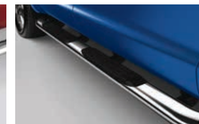
Barres-marchepieds latérales chromées de 5 po