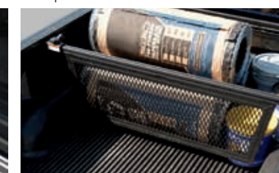
Séparateur de caisse