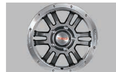
Roues de 17 po hors route forgées TRD