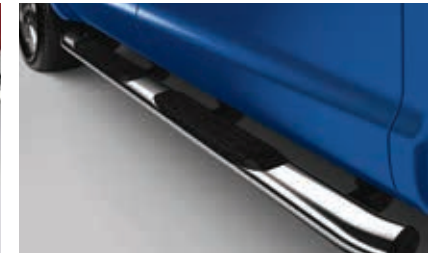
Barres-marchepieds latérales chromées de 5 po