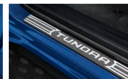
Protecteurs de seuil de portières