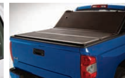
Couvre-caisse rigide à trois panneaux repliables