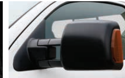
Rétroviseurs de remorquage