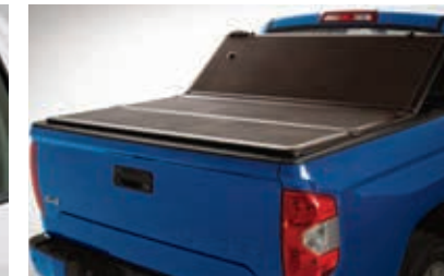
Couvre-caisse rigide à trois panneaux repliables