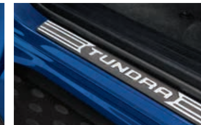
Protecteurs de seuil de portières